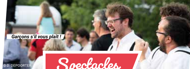
Garçons s'il vous plaît!

Juillet 2021 > Juin 2022 | Base de Loisirs | Taupont