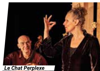
Le Chat Perleux

Mardi 10 août | 21h | Cour de l'horloge astronomique Ploërmel